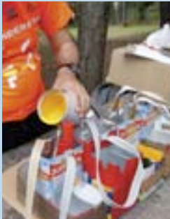
En el periodo de formación, los voluntarios aprendieron, entre otras cosas, a construir cestas porta-pintura con envases de zumo y leche.

Tras un periodo de preparación, en septiembre del 2011 la FMM puso en marcha el Plan de Voluntariado de Senderos. "Colgó" en su página web un documento con los objetivos del plan, su organización y la metodología, y abrió la inscripción de voluntarios. La respuesta asombró hasta lo más optimistas. En pocas semanas se recibieron 250 inscripciones y hubo que cerrar temporalmente la inscripción por miedo a no poder hacer frente a tanta petición. Entre los inscritos había aficionados de todas las edades y sexo, aunque predominaban los hombres, pero lo que más sorprendió a los responsables de la campaña fue que 69 por ciento de los inscritos no es-