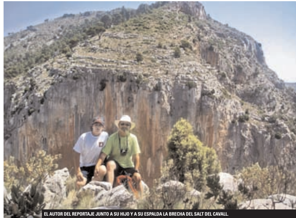
EL AUTOR DEL REPORTAJE JUNTO A SU HIJO Y A SU ESPALDA LA BRECHA DEL SALT DEL CAVALL

P ODRÍAMOS comenzar a caminar en la propia Alcora, pero teniendo en cuenta que los primeros kilómetros transcurren por la carretera comarcal CV-192, sugerimos llegar en automóvil hasta la aldea de Araya, a sólo seis kilómetros. No nos costará encontrar la pista que une esta aldea con el pueblo de Lucena del Cid, y que guiará buena parte de nuestro