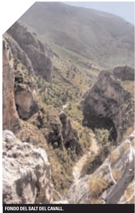
FONDO DEL SALT DEL CAVALL

EL SALT DEL CAVALL ES UNA GIGANTESCA HENDIDURA DE MÁS DE DOSCIENTOS METROS DE ANCHURA Y SETENTA DE ALTURA ABIERTA EN LOS MONTES DE LA COMARCA DE ALCATÉN. DICHO ASÍ SUENA MÁS BIEN FRÍO, PERO NO CONOZCO A NADIE QUE LO HAYA VISITADO Y QUEDARA INDIFERENTE.